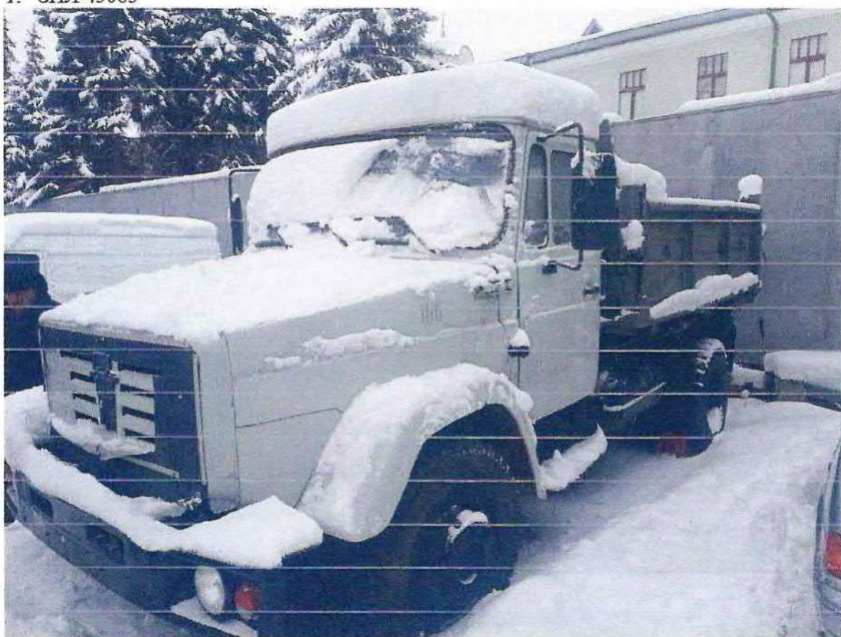
1. ЗИЛ 45065